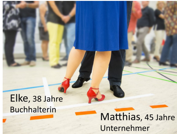
Elke, 38 Jahre Buchhalterin

Bei den Fortgeschrittenen kommen dann weitere und kompliziertere Figuren dazu.